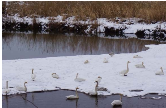
オオハクチョウの群れ

帰ろうとして流入水路の傍らの道を通りかかると、そこにはオオハクチョウの群れ。丸くなって休んだり、一部は見張り役なのか首を伸ばしている。こんなに近くで自然のオオハクチョウの群れを見るのは始めてである。前日にねぐら入りの見られる夕方訪れることこそできなかったが、満足して帰途についた。