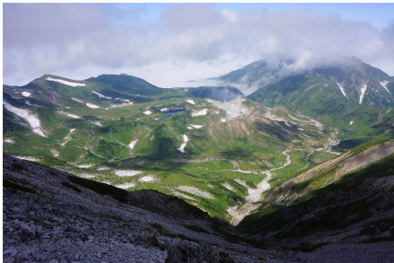
立山縦走路から見下ろす弥陀ヶ原

翌日は早朝に山荘を出発して雄山から大汝峰、富士ノ折立、真砂岳、別山と立山連峰の縦走。好天に恵まれて楽しい尾根歩きと北アルプスの景観を楽しむことができた。縦走路から雷鳥沢に降り、地獄谷の風下では噴気による亜硫酸ガスに咳き込みながら弥陀ヶ原を歩き室堂に戻ると、ここは一般の観光客でごった返していた。