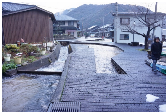
再現された船溜り

このあたりは平地が次第に狭まり山間部に入る所で、水路は急流のため水深を深く取れず川底に桐木を敷設して船を滑らせながら人力で引き上げる工夫がなされていた。訪れてみるとやはり相当の急勾配で、荷物を積んだ船を引き上げるのは相当に大変だったと思う。さらに疋田から先を滋賀県側に向かうには深坂峠などで山地を越えねばならず、また琵琶湖と日本海との水位差もあり、船の通行できる水路を造るにはトンネルや多くの堰などが必要となり容易でないと伺われる。