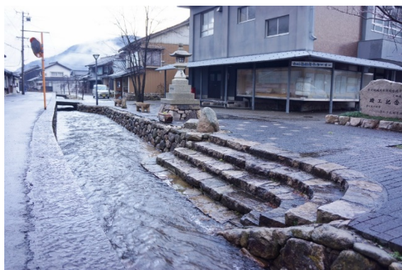
疋田舟川の石積み

その宿場町の面影の残る細長い集落に沿って、かなり急勾配の水路がある。当時の川幅は九尺(約3m)で、現在は左岸側が道路に埋め立てられて狭くなっているが、右岸側には石積みと水面に降りる石段や洗い場などが残されている。集落の上手には往時の船溜りの場所を示す石碑もある。そこでは荷物の積み替えでにぎわったのであろう。